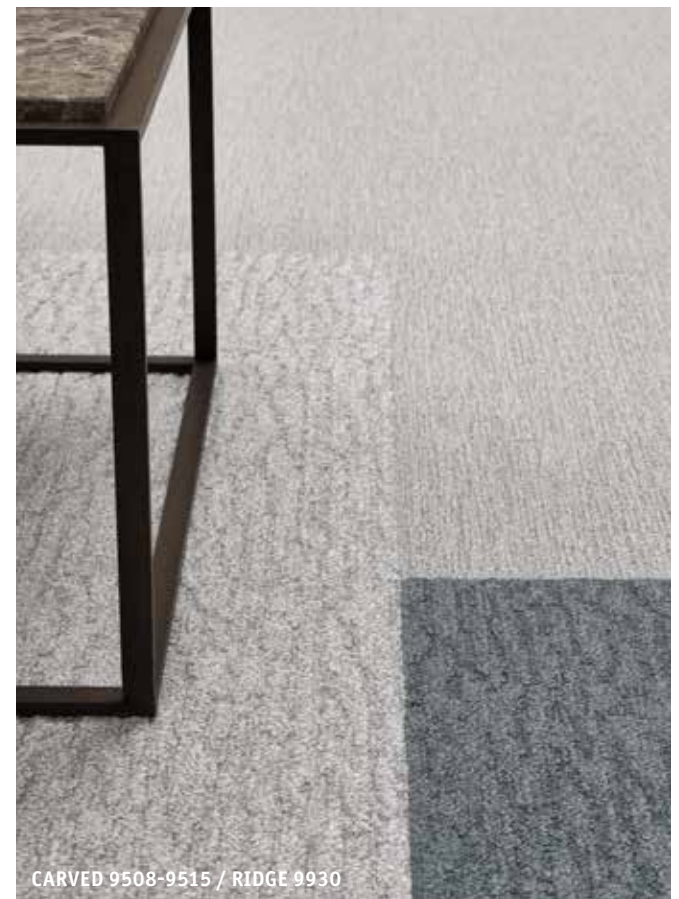
CARVED 9508-9515 / RIDGE 9930