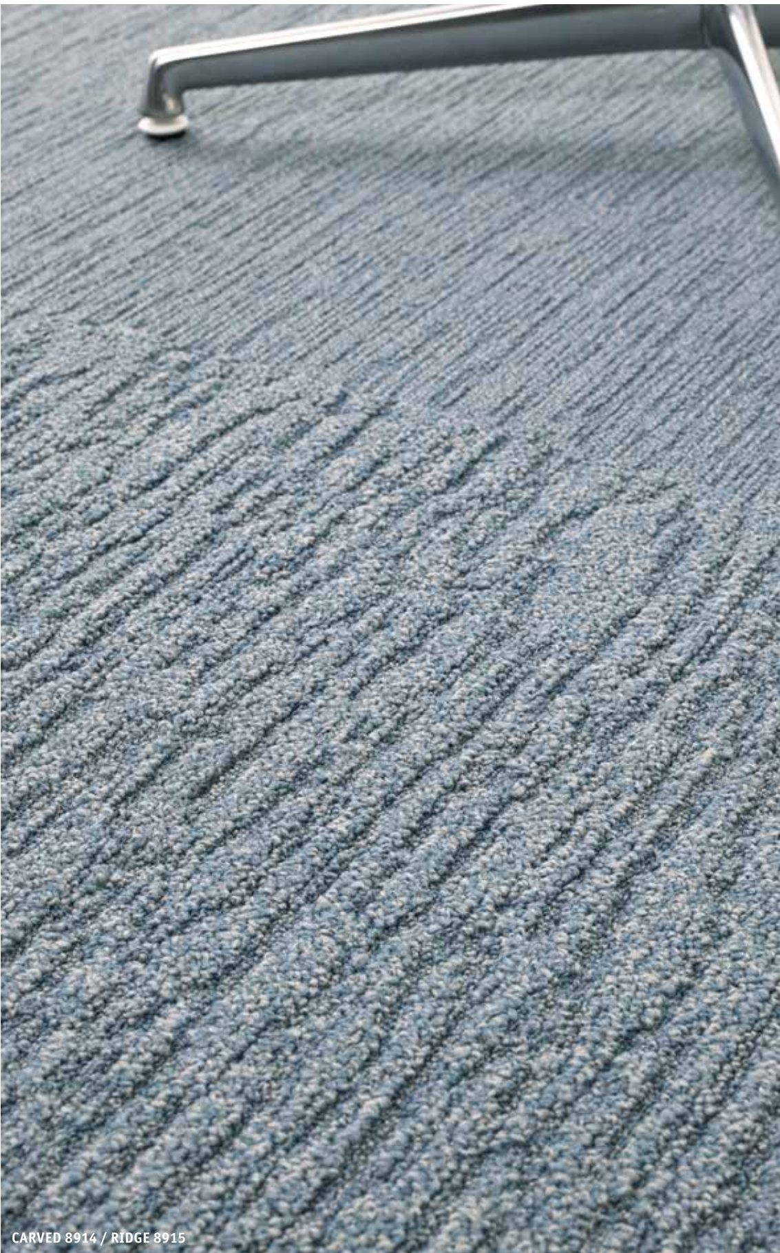
CARVED 8914 / RIDGE 8915