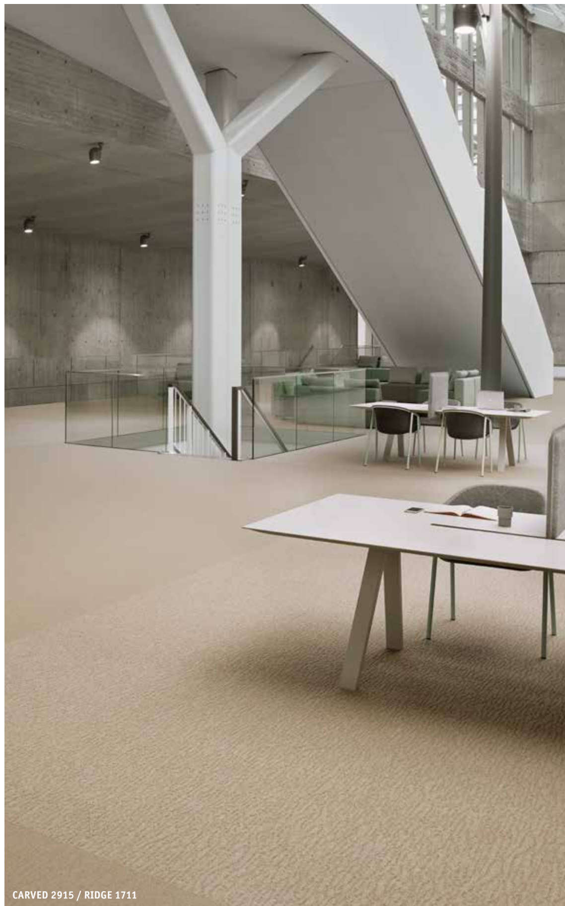
CARVED 2915 / RIDGE 1711