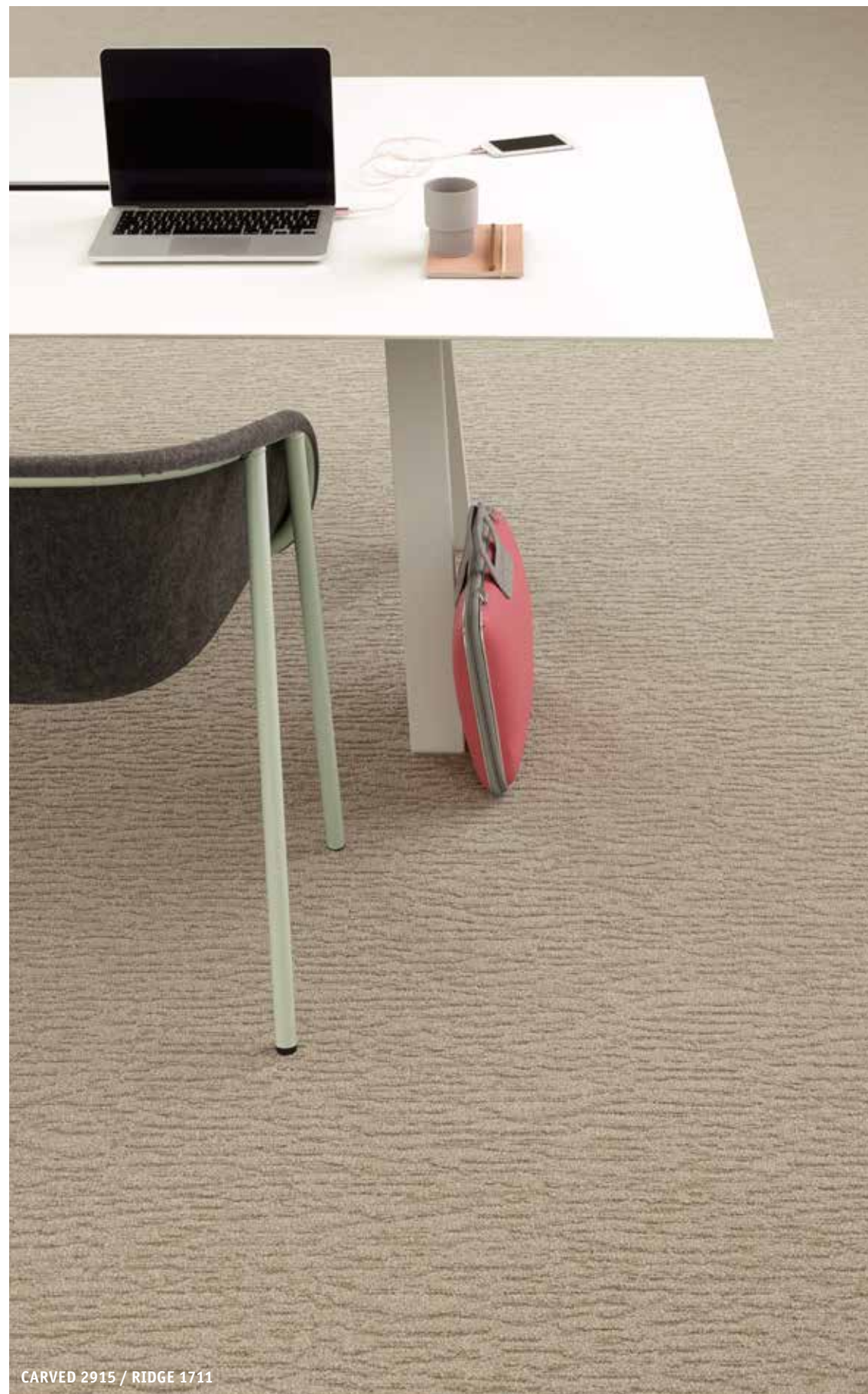
CARVED 2915 / RIDGE 1711