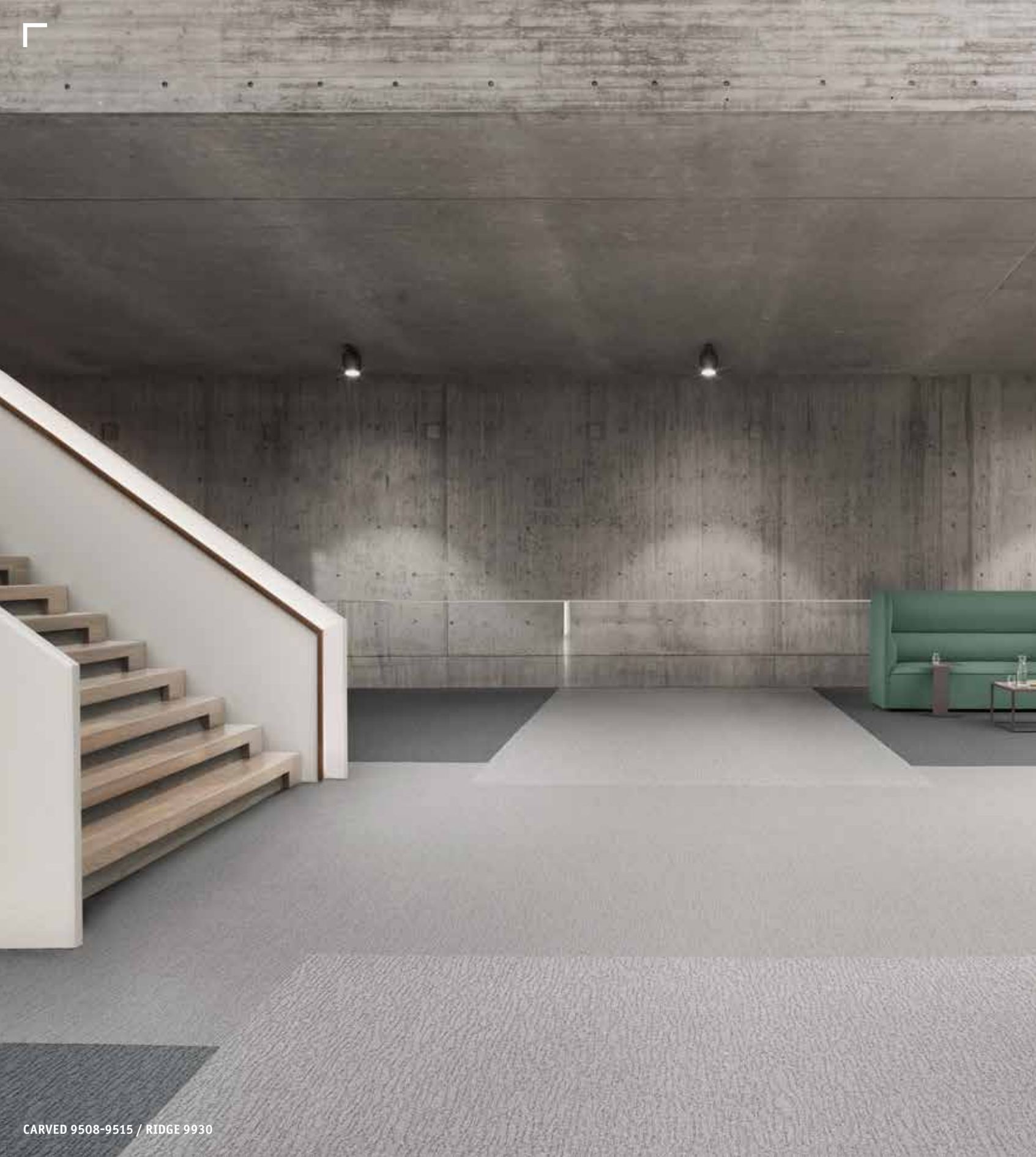
CARVED 9508-9515 / RIDGE 9930