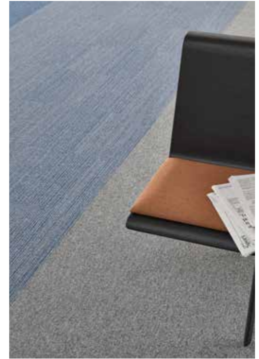
Essence 8413, 9005 / Essence Stripe 8522