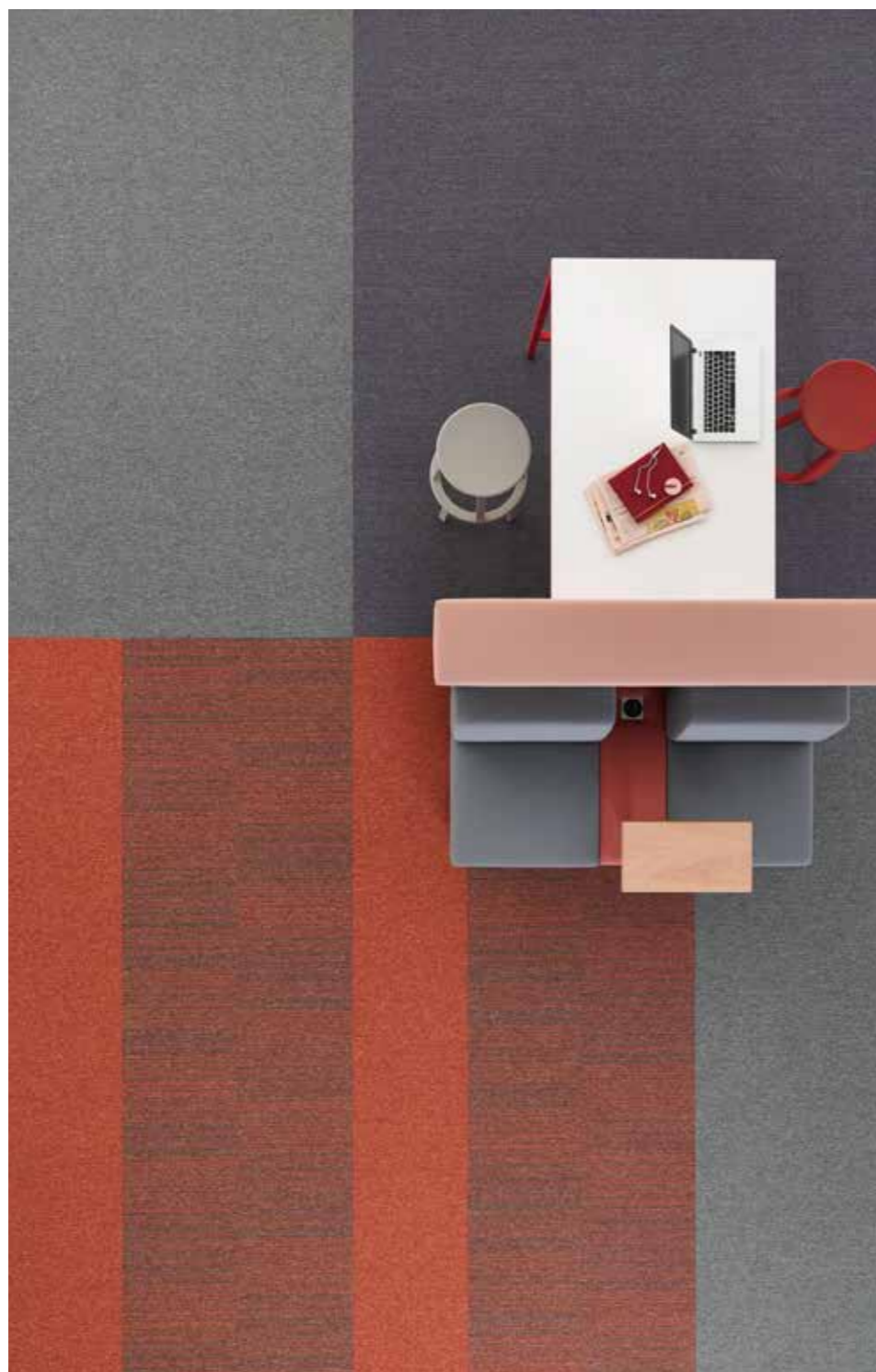
Essence 5012, 9504 / Essence Stripe 5102, 3211